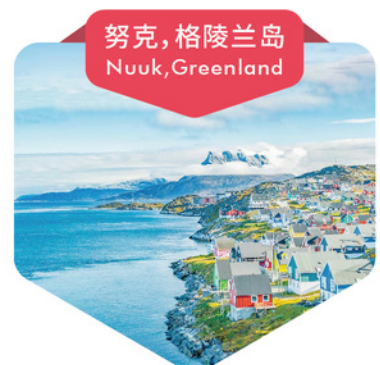
努克, 格陵兰岛 Nuuk, Greenland