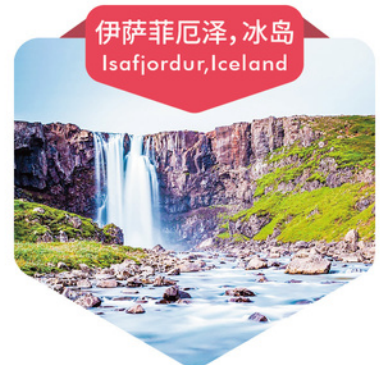
伊萨菲厄泽, 冰岛 Isafjordur, Iceland