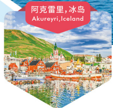
阿克雷里, 冰岛 Akureyri, Iceland