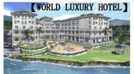
【WORLD LUXURY HOTEL】

住宿: 舒琪港 4 星**** Sooke Prestige Oceanfront Resort