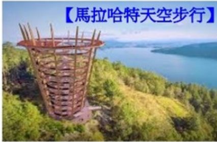
【馬拉哈特天空步行】