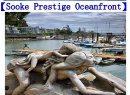
【Sooke Prestige Oceanfront】